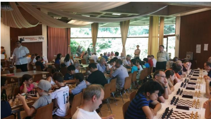
Ein Blick in den Turniersaal

Wie es sich für ein Ferdinand Peitl Turnier gehört, bekamen alle Teilnehmer eine Urkunde und einen Sachpreis.